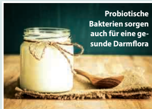
Probiotische Bakterien sorgen auch für eine gesunde Darmflora

Auf unserer Haut tummeln sich von Natur aus Abertausende von Bakterien und Keime. Probiotische Lacto-Bakterien in Cremes & Co. haben die Aufgabe, die Mikroflora unserer Haut zu verbessern, indem sie negative Bakterien verdrängen und positive unterstützen. So wird die natürliche Balance der Haut erhalten und die Hautbarriere gestärkt. Probiotische Produkte bieten also mehr Schutz gegen schlechte Umwelteinflüsse wie Abgase oder UV-Strahlen, die durch freie Radikale Hautschäden verursachen können. Der Teint bleibt so länger jugendlich-frisch, straff und schön. Probiotika erhöhen zudem den Urea-Anteil in der Haut. Da der Harnstoff