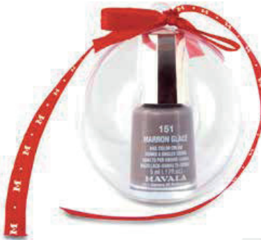
TROCKNET SCHNELL. Mavala Mini Color, € 5,90