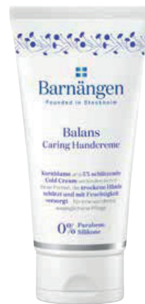
TÄGLICHE PFLEGE. Barnängen Balans Handcreme, 75 ml um € 3,49