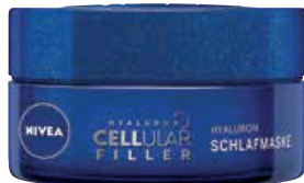
SCHÖN IM SCHLAF. Hyaluron Cellular Filler Schlafmaske von Nivea, € 15,99

Immer up to date mit den Beauty-News der STEIRERIN.