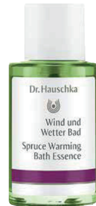
WOHLTUEND. Wind und Wetter Bad von Dr. Hauschka, 30 ml um € 6,-