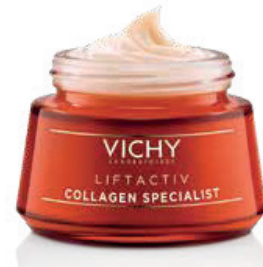
ANTI-AGE-POWER. Liftactiv Collagen Specialist von Vichy, € 35,90

ENTGELTLICHE EINSCHALTUNG