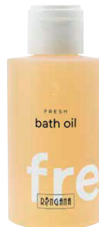
ENTSPANNEND. Fresh Bath Oil Lavender von Ringana, 125 ml um € 32,30

Zum eigenen Gebrauch nach §42a UrhG. Anfragen zu weiteren Nutzungsrechten an den Verlag oder Ihren Medienbeobachter.